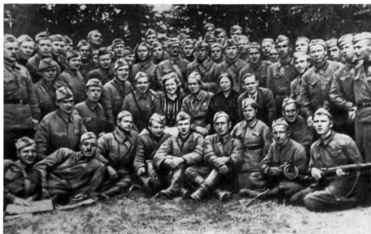
Делегация рабочих завода «Калибр» среди ополченцев-калибровцев на фронте