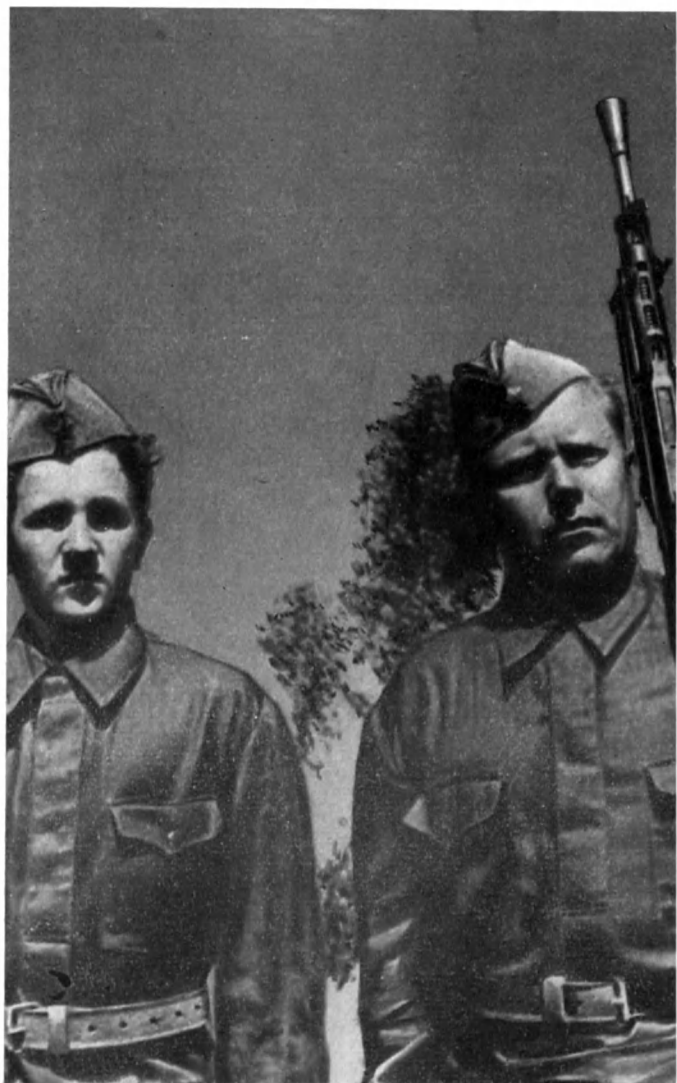
Отец и сын Можаровы — бойцы 1-й ДНО Ленинского района