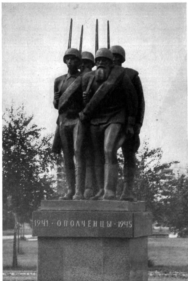
Памятник «Ополченцам Москвы» (скульптор О. С. Кирюхин, архитектор А. П. Еришов, 1974 г.)