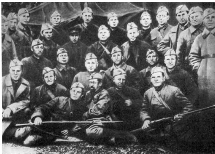
Делегаты партийной конференции 5-й ДНО. Сентябрь 1941 г.