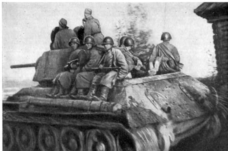
Танковый десант. 4-я ДНО