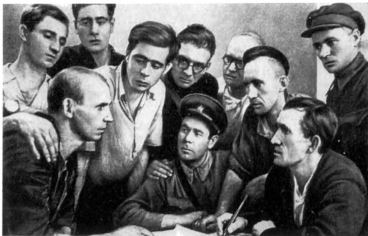
Группа рабочих и служащих завода «Изолятор» — добровольцев народного ополчения