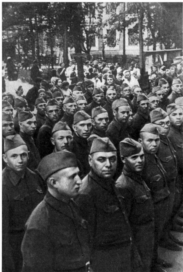
Командиры и политработники 6-й ДНО перед отправкой на фронт