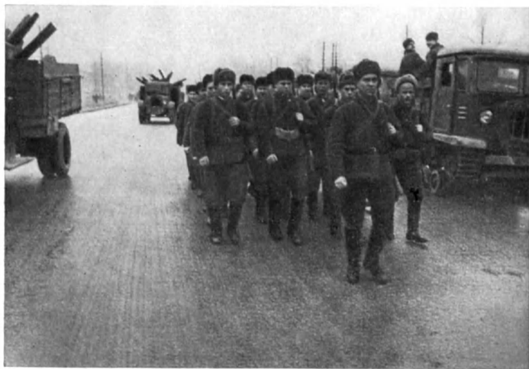
На защиту Москвы уходят бойцы рабочего отряда Москворецкого района. Ноябрь 1941 г.