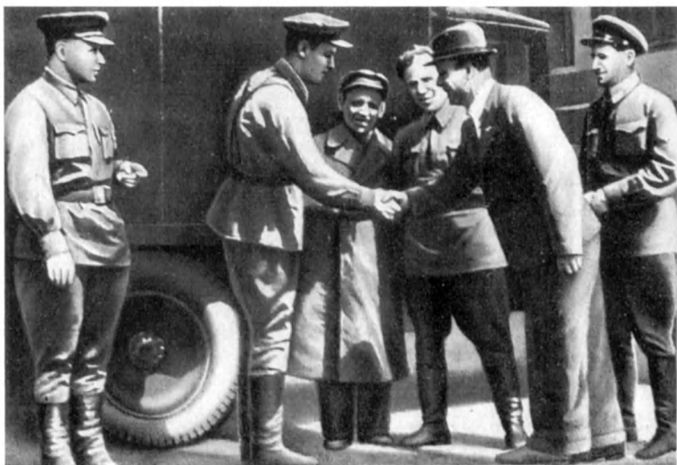
Передача агитмашины делегацией Ленинградского района командованию 18-й сд. Ноябрь 1941 г.