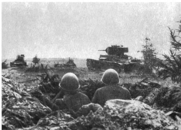
Бойцы рабочего батальона москвичей на огневой позиции