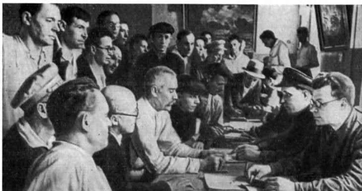
Запись добровольцев Ленинского района в народное ополчение