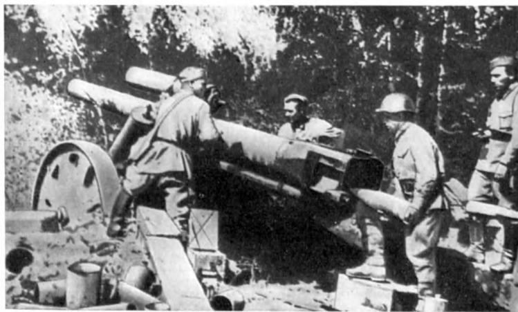
Орудийный расчет. 110-я сд. 1942 г.