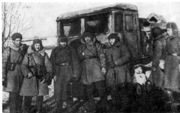
Артиллерийский полк 110-й сд на марше в районе Наро-Фоминска. Декабрь 1941 г.