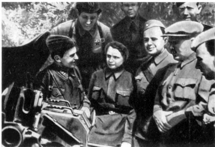
Делегация трудящихся Куйбышевского района на передовых позициях 110-й сд (МИРМ)